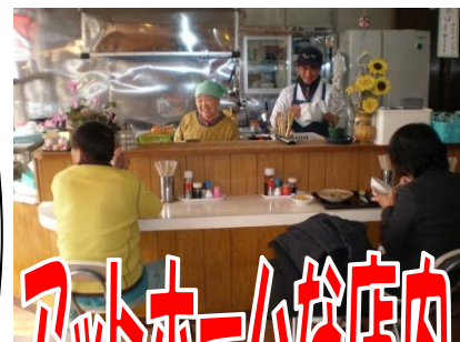
アットホームな店内

住所 八王子市絹ヶ丘 1-51-9 TEL 042-635-3473 営業時間 11:00~20:00 定休日 第4土曜日・日曜日・祝日