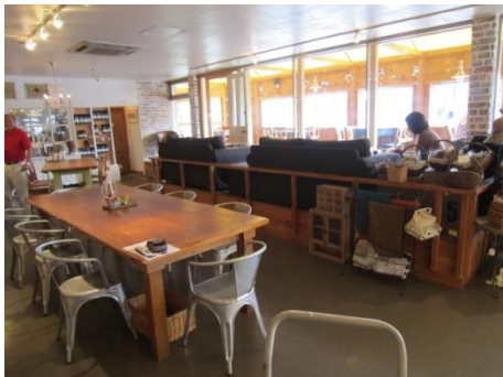
店内でお召し上がりできます