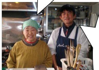
おかみさんと店長さん