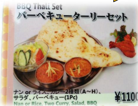
バーベキューターリーセット 1,100円