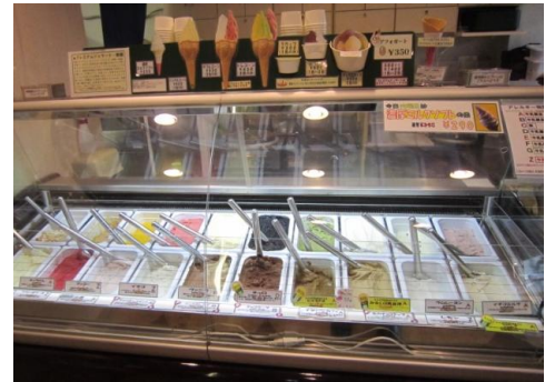
店内でも食べられます