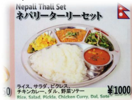
ネパリーターリーセット 1,000円

住所 八王子市大塚 466-5 TEL 042-674-8238 営業時間 11:00~15:00 (ランチタイム) 17:00~23:00 (ディナータイム) (ラストオーダー22:00) 定休日 月曜日