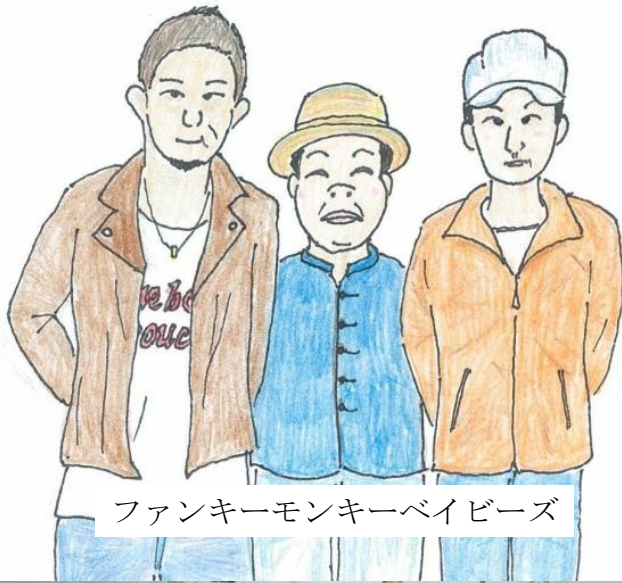
ファンキーモンキーベイズ