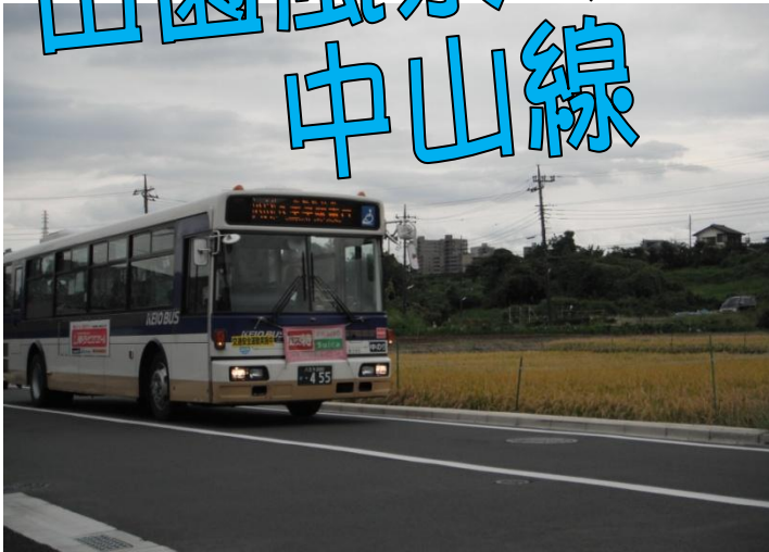
← 田園の横を走り去る中山線

今回の特集は自然豊かな中山線 JR八王子駅南口～京王相模原線南大沢駅（中山経由9・2キロ）を結ぶ路線です。この路線は、八王子駅南口から野猿峠までは殿ヶ谷戸経由と同じ路線を走ります。野猿峠バス停から先の信号を斜め右に入り狭いカーブへと続きます。中山バス停からは殿ヶ谷戸経由とは違った車窓風景が広がり手前に田園、遠くに南大沢のマンション群が望めます。柳沢バス停から殿ヶ谷戸経由と同じ経路を走り南大沢駅へと向かいます。今回はどんな出会いがありますでしょうか。