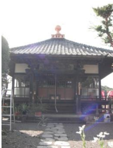
↑ 12年に一度に開扉される 武相観音十一面観音堂