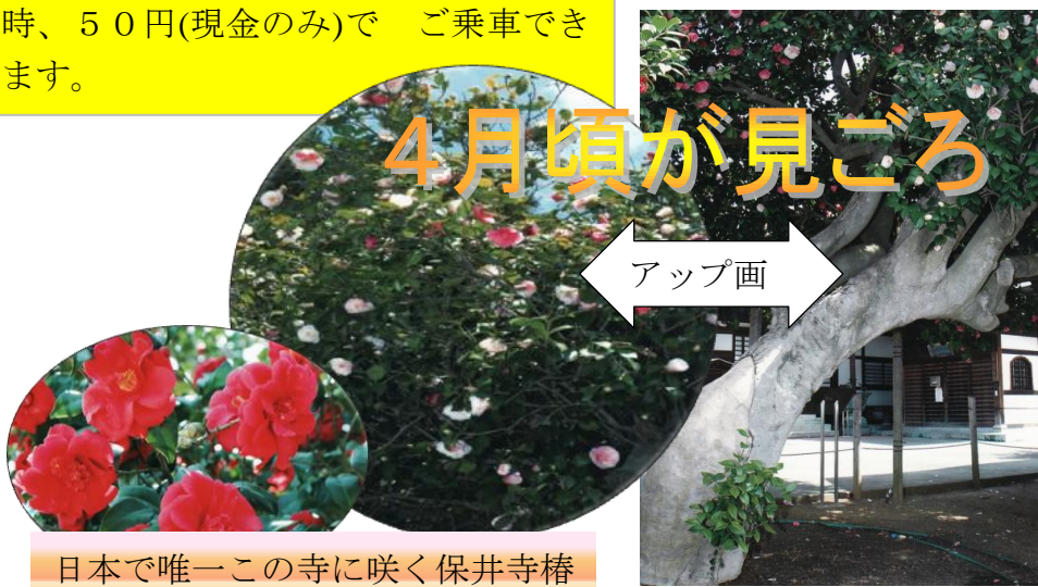
日本で唯一この寺に咲く保井寺椿