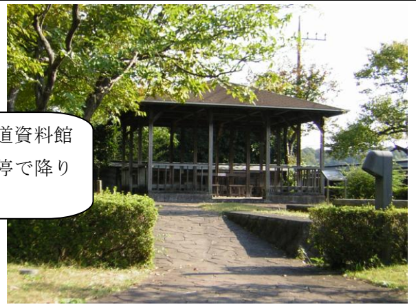
絹の道資料館 (入館無料)