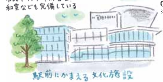
駅前にかまえる文化施設

⑥ カレー好きに愛される、カレー専門店。 ⑦ 辛さやサイズが選べる。 ⑧ インパクト大、ボリュームたっぷり!!