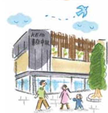
絵と文 すげさわ かよ

② 航空自衛隊府中基地 http://www.mod.go.jp/asdf/fuchu ☎ 042-362-2971 内線 2508 (渉外班)