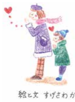
絵と文 すげさわかよ