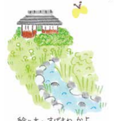
絵と文・すげさわ かよ