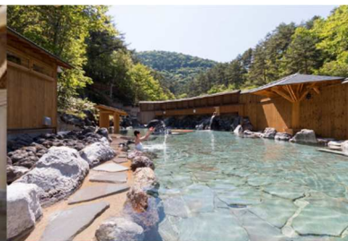
西の河原露天風呂