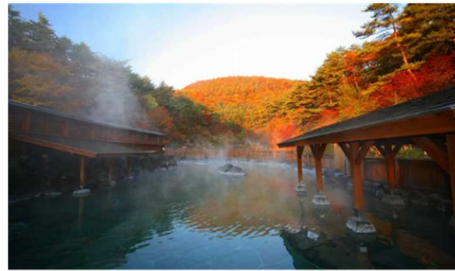
西の河原露天風呂