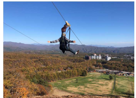
バンジップテング

空中に架線したワイヤーロープを専用の滑車及びハーネスによって滑空！全長 500m、高低差 108m、最高速度 70km/h、日本一の急勾配 22%を誇り、標高 1,370mの天狗山山頂から、草津温泉街はもちろん遠方の山々の眺望もご覧いただけるスリル満点の爽快絶叫アトラクション！