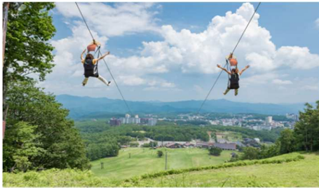
バンジップテング

2021年 8 月 19 日(木)より、日本三名泉のひとつである草津温泉入浴や魅力的なアクティビティと、現地までの高速バス往復乗車券がセットになった 3 つのプランを、アプリ限定の特別価格で販売いたします。最大 20%割引と大変お得になっておりますので、今年の秋は「草津 湯～わく手形」で草津を満喫してください！