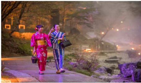
浴衣 de 散歩