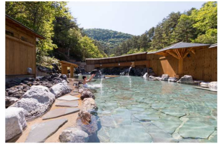
西の河原露天風呂